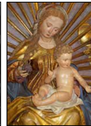
Pacher Madonna (1498)